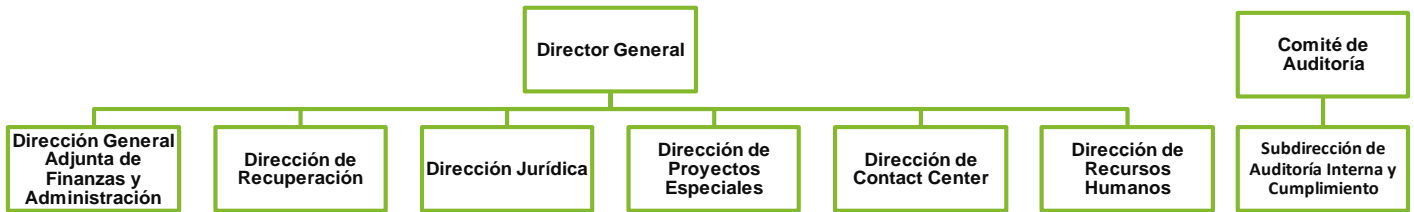
Figura 2. Estructura Organizacional